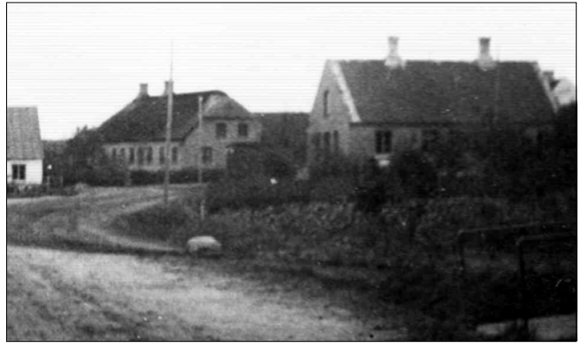
Høkerens butik til højre