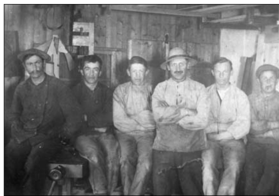
Folkene på værkstedet

Vi børn blev holdt til ilden, både hvad arbejde og pligter angik. Der var ikke noget med at snakke ved bordet, eller blande sig i de voksnes snak. Mor lavede god mad, men var den ikke helt efter ens smag, var det ikke klogt at luften sin utilfredshed. I en tilbygning til værkstedet var der hestestald og svinesti. I et hjørne for sig var der lokum. Vi havde en lille fladvogn, som vi spændte hesten for, når vi skulle have materialer bragt ud til en arbejdsplads. Den første hest, vi havde, var hvid og blev kaldt "Musen". Det var den mest dovne hest, jeg nogensinde har kendt. Den var ikke til at få ud af gården, før den havde været henne ved køkkenvinduet og fået en humpel rugbrød. Den fandt også ud af, at når det ikke var far der kørte, så stoppede den op, når det passede den. En tur, der normalt ville tage en time, kunne så godt tage to, for vi nænnede jo ikke slå på den.