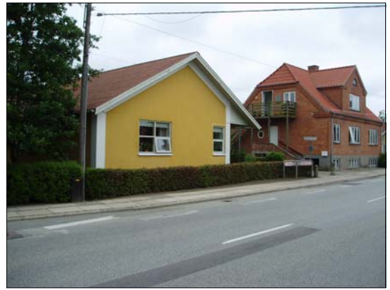
Haases Gård, foto 2004