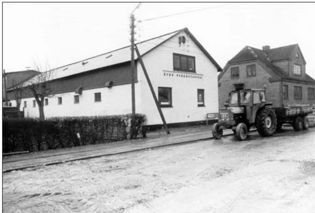
Lagerbygning og beboelse, foto 1989