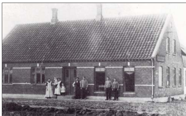
Haases ejendom og værksted

Min far startede tømrer- og snedkerværksted 1 i 1904 i Øster Hornum. Med tiden blev vi 10 søskende, 3 piger og 7 drenge. Far var vist anerkendt som en dygtig håndværker, for han var meget krævende med arbejdets udførelse. Det opdagede jeg, om ikke før så da jeg kom i lære.