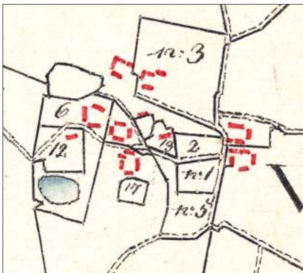
Kort over Volstrup 1816