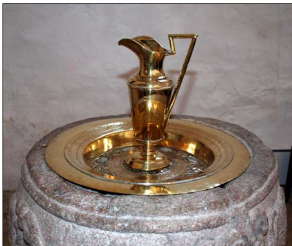
Døbefonden i Øster Hornum Kirke