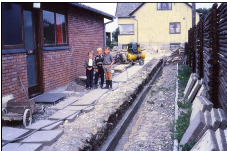
Kanal til fjernvarmerør i begyndelsen af 1960'erne. Hvor rørene lå, slap man for at feje sne om vinteren, da isoleringen af rørene ikke var særlig god

hvilket blev brugt for eksempel til at sprænge store sten med, hvis en landmand traf på en som lå i vejen for at anvende markredskaberne. Dette hus har i dag adressen Sandgraven 6. Han kunne imidlertid ikke komme med da det lå for langt væk fra varmecentralen. Det er en ret interessant oplysning, når man tænker på i dag, hvor man uden problemer kommer ud til de fjerneste huse i byen.