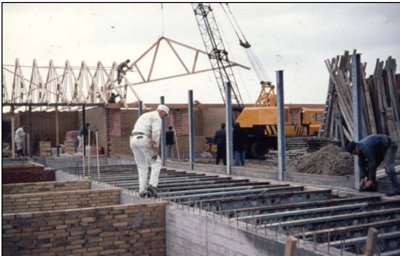
Hvor det var planen, der i 1966 skulle opføres fjernvarmeværk, blev der i 1969 opført ældrecenter Birkehøj

Alt dette var før vi fik den store kloakering gennemført i slutningen af 1960'erne.