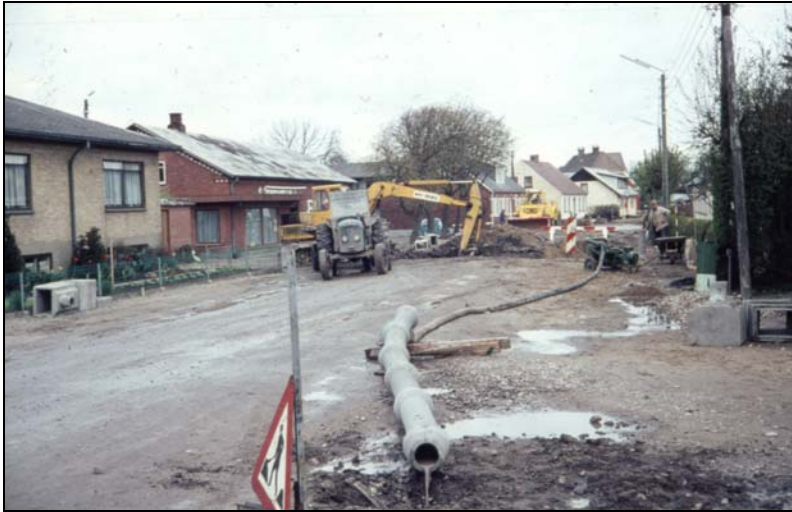
Der måtte pumpes store mængde vand for at kloakeringen gennem byen kunne gennemføres

slags cellebeton, noget lignende materialet i en ciporex blok.