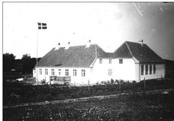
Den ny skole