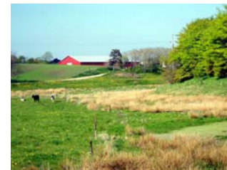
Engdrag ved Estrup