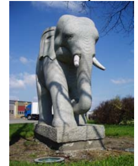
Elefanten i Sørup

Rute, billeder og beskrivelse udarbejdet 2005 af Niels Nørgaard Nielsen for Størring kommunes Grønne Råd