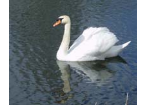
Svane i Mastrup Sø