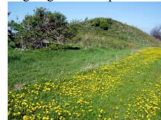
Tinghøj ved Øster Hornum