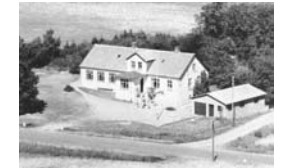
Hæsnum Skole 1947