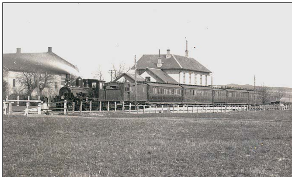
Tog på Støvring Station

”Ding-di-dong, Ding-di-dong – regionaltog fra Aalborg mod Suldrup med stop i Harrild, Byrsted og Kirketerp afgår fra spor 2 om få minutter”. Dette kunne have lydt fra højtalerne på stationen i Øster Hornum, hvis initiativrige folk for knap 100 år siden havde haft magt som de havde agt.