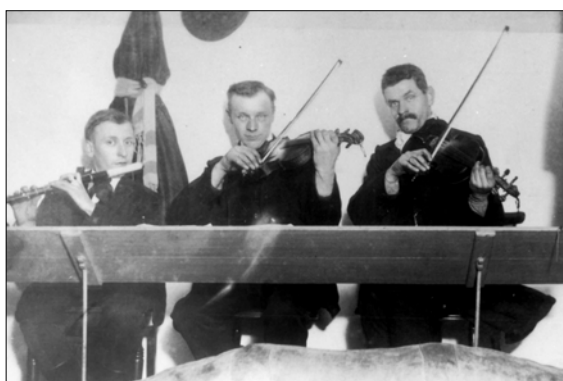
Musikere fra Byrsted og Bradsted 1938