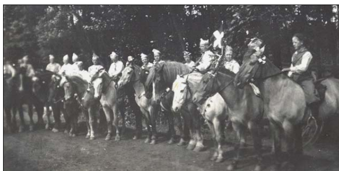
Klar til ringridning i Hæsum

Ringridningen foregik en søndag formiddag. Der var mange tilskuere, såvel de lokale som pårørende til de deltagende ryttere. Blandt disse kunne jeg staks genkende mine forældre, som pr. cykel var draget til Hæsum for at overvære skuespillet. Heldigvis nåede jeg ikke at blive ”græsrytter”, altså at blive slået af hesten, for det blev betragtet som en skam. Men mere nåede jeg da heller ikke.