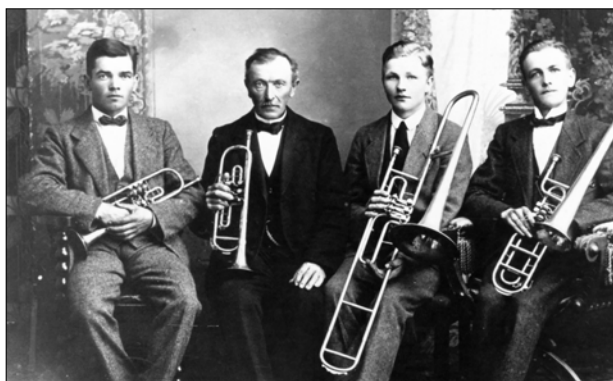
Musikere fra Suldrup ca. 1920

Kolonnen red fra gård til gård, og gårdejerer og hans hushold ville komme ud for at betragte kolonnen i dens fulde glans. Kong Per ville invitere alle på gården til at deltage i dansen den aften. Musikken ville spille hvad gårdejerer valgte, eller han lod måske andre af husholdet have valget. Bakker med forfriskninger, forberedte i forventning af vort besøg, blev bragt ud for os.