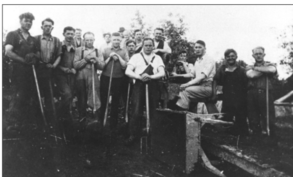
Bydammen anlægges 1937

I denne forbindelse skal lige nævnes, at idrætslederne den gang var ulønnede, men udelukkende udførte et stort arbejde af interesse og på frivillig basis.