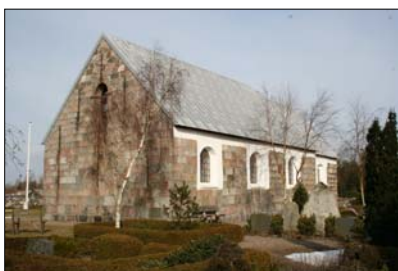
Dragstrup Kirke på Mors

Kirkens vinduer, syv i alt, var ved kirkens opførelse som nævnt meget små. Vinduerne, der vender mod nord, er de oprindelige. Inventaret i kirken har på den tid været meget spartansk. Midt mellem de to døre stod døbefonden, den samme der står i kirken nu. Alterbordet stod som nu i korets østligste ende. Om dets eventuelle udsmykning og relikvier ved man intet. Langs væggene i skibet var en slags murede bænke, hvor de ældste og skrøbeligste af menigheden kunne sidde under de til tider langvarige gudstjenester. Af udseende har kirken sikkert, fraregnet vinduerne, set ud nogenlunde som kirken i Volsted, kirken i Ellidshøj eller den her viste Dragstrup Kirke på Mors.