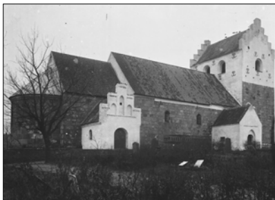
Kirken før 1938

de sang de nye dansksprogede salmer og hørte præstens til tider meget lange prædiken. På et tidspunkt blev der indsat en temmelig bred dør i sakristiet, der nu i stedet for at blive brugt til opbevaring af kirkens liturgiske udstyr, fx alterkalk, lysestager, oblatæske og præstens messehagler, blev omdannet til ligkapel. Ved samme lejlighed blev døren fra sakristiet til koret muret til. Som et kuriosum kan nævnes, at det gamle vievandskar fra katolsk tid blev indmuret, kun halvt synlig, i sakristiets ydre vestvæg. Man kan have ment at det kunne være uheldsvangert helt at forkaste alt med tilknytning til den gamle tro.