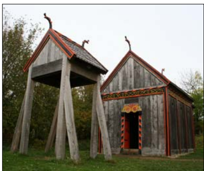
Trækirken ved Moesgård

Hvem der har været kirkens bygmester er umuligt at vide, men det er sikkert, at det har været én af de omrejsende bygmestre, der på den tid forestod bygningen af et stort antal af de nuværende landsbykirker. Som arbejdskraft til det mere slidsomme arbejde som fx at slæbe sten til bygningsarbejdet har de lokale beboere ydet deres indsats.