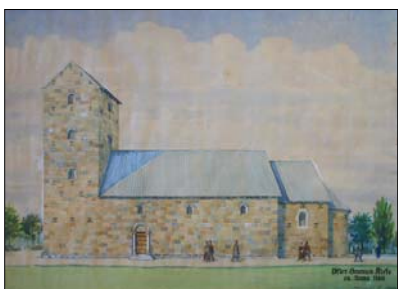
Kirken i 1400-tallet 3

Kirkebygningen bestod som nævnt af et romansk skib, kor og apsis. Kort efter kirkens opførelse, stadig i romansk tid i begyndelsen af 1200-tallet, blev der tilbygget en forhal i vest. Om forhallen var bygget i granit som den øvrige kirke er en mulighed, men andre materialer kan være anvendt. Gennemgangen fra skib til forhal, hvor døbefonden muligvis i en periode har stået, var efter al sandsynlighed en dobbeltarkade, måske noget i stil med hvad man kan se i fx Fjenneslev eller Tveje Merløse Kirke.