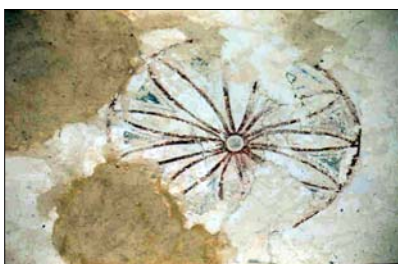
Kalkmaleri over korbuen

På kirkens nordside blev der opført både et våbenhus og et sakristi. Det gamle flade bjælkeloft blev brudt ned og erstattet af høje krydshvælvninger bygget af teglsten i såvel skib, kor som apsis. I koret blev sydvinduet gjort større, mens nordvinduet blev afblændet. Syddøren blev ligeledes muret til. Senere blev vinduerne i sydsiden gjort større, så kirken indvendig kom til at fremtræde mere lys og himmelstræbende i overensstemmelse med tidens teologi.