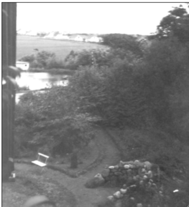
Vandkraftværket anes yderst til venstre – tilsyneladende det eneste eksisterende billede af værket