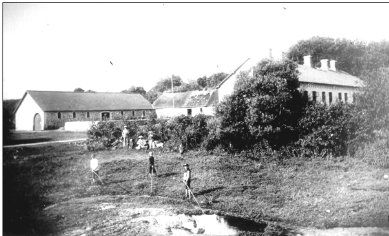
Præstegården i begyndelsen af 1900-tallet

I gamle dage henne ved Katbakken, hvor sportspladsen er nu, der kunne vi køre på kælk om vinteren. Det var en bane på næsten en halv kilometer, vi kunne køre, men så var der jo et forfærdeligt arbejde med at få kælken slæbt op igen. Vi kunne jo køre helt ned til landevejen. Når det gik rigtig godt, kunne vi jo endda køre tværs over landevejen, for der var jo ingen biler dengang. I det område kunne vi også fange haletudser og sådan noget dengang før sportspladsen blev anlagt.