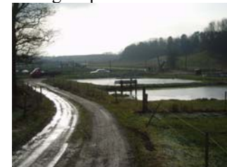
Dambrug ved Sønderhede