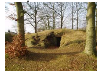
Jættestuen i Suldrup