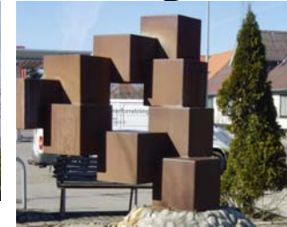
Stjernen i Suldrup