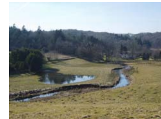
Sønderup Ådal ved Hyldal