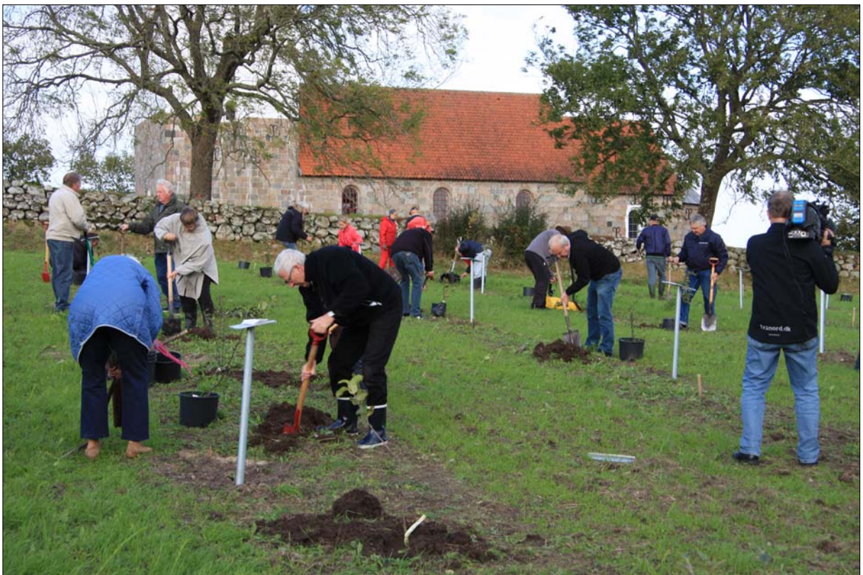
I løbet af et kvarters tid var de mange æbletræer plantet, og de mange fremmødte fik serveret æblekage, friskpresset æblesaft og kaffe – og snakken gik lystigt efter vel overstået arbejde!!

Efter det herlige arbejde var der kaffe og skovturskage (Øster Hornums nationalkage valgt af alle byens børn), der var friskpresset æblesaft af Ingrid Marie æbler, og der var mange lovord til menighedsrådets initiativ. Nu er fortiden så plantet for fremtiden og i løbet af få år vil der være æbler som frit kan stjæles af alle i byen.