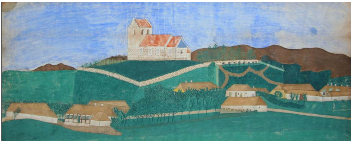
Maleri af Øster Hornum 1866. Yderst til højre ses præstegården og bagved den ligger den nyanlagte Æblehave. Den nuværende Æblehave anlægges syd for kirkediget